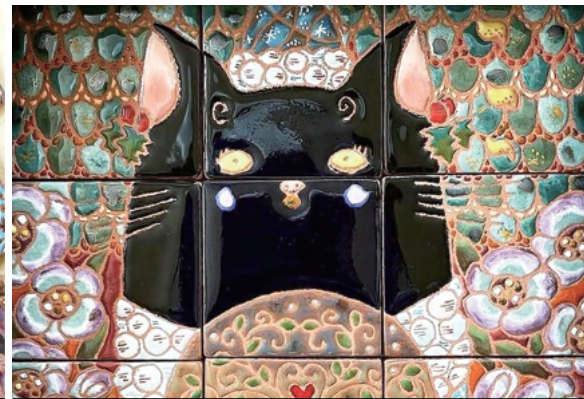
「黒猫とユグドラシルスノウドーム」