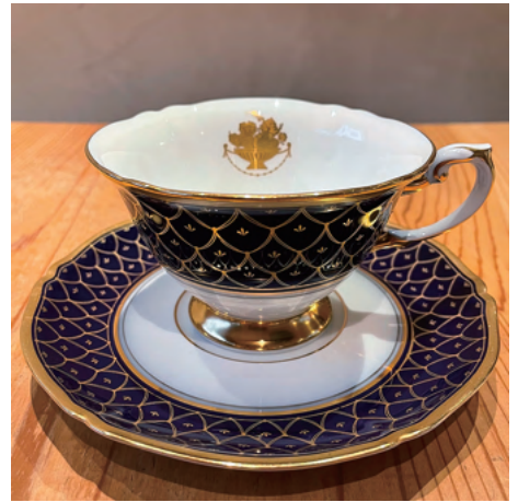
フルーツ盛りのデザイン 均等な絵柄に目を奪われます