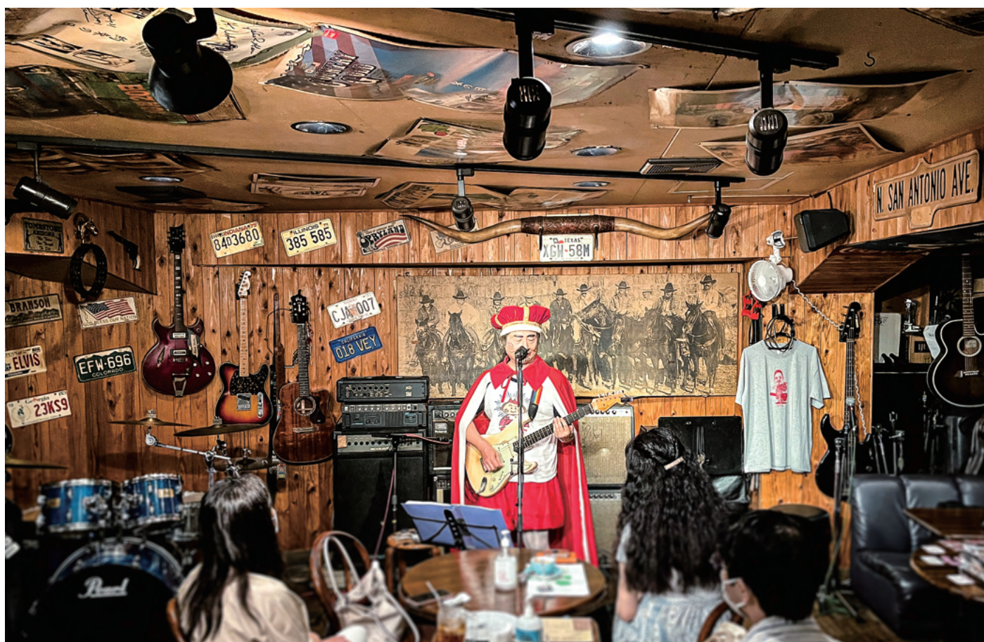
西宮市出身のアーティスト「王様」のライブ風景