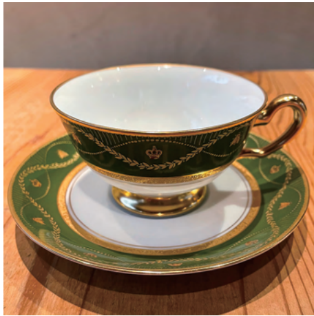
深い緑色で落ち着いたデザイン 王冠マークはナポレオンの印です