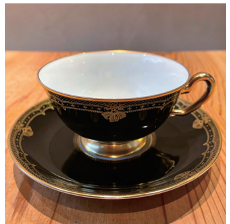
今はもう手に入らない貴重な黒カップ 飲み口の柄がとても繊細です