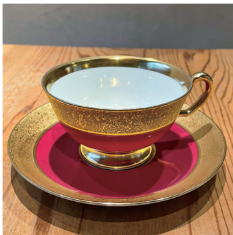
金を沢山使用した贅沢なカップ 金の凸凹に触れてみよう！