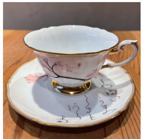
ソメイヨシノの可愛いカップ 淵の線は一本一本 金付けされています