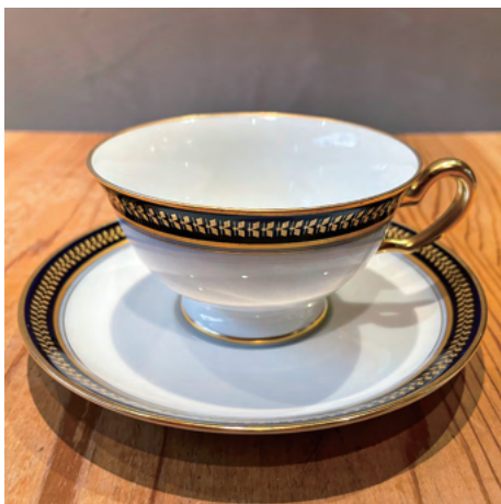
コバルトブルーのラインがかっこいいデザイン ラインの一つ一つの模様注目！