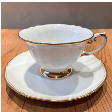
模様が入っていないホワイトマスターピース なんといっても色の白さに驚きます