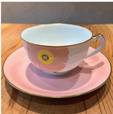
花柄の可愛いデザイン けしの花をモチーフにしたカップです