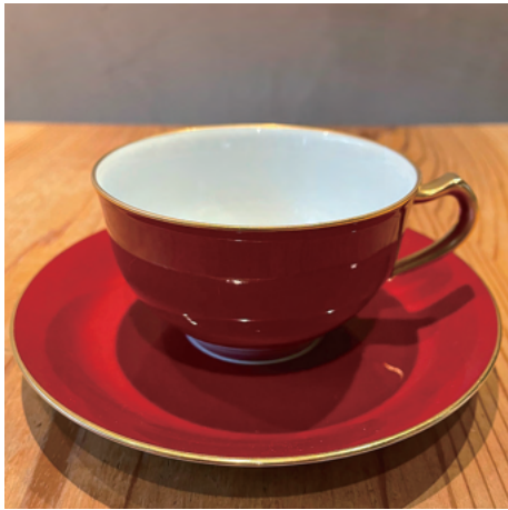
ゴールドブレンドのCMに起用されたカップ カップ内側の色の白さが際立ちます