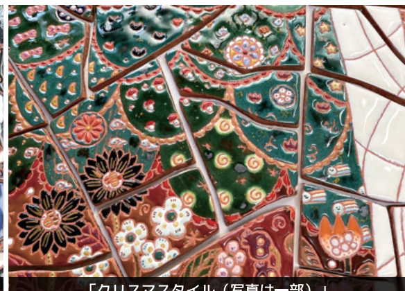
「クリスマススタイル (写真は一部)」